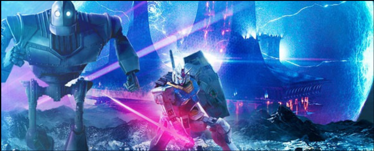
영화 <레디 플레이어 원>